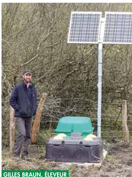
GILLES BRAUN, ÉLEVEUR DE BLACK ANGUS AU LUXEMBOURG

« Je suis éleveur de Black Angus dans un programme « biodiversité » où mes animaux sont au pâturage toute l'année. Pour l'alimentation